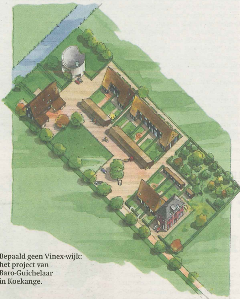
Bepaald geen Vinex-wijk: het project van Baro-Guichelaar in Koekange.

Nieuwbouw in Koekange voorkomt het wegtrekken van jonge